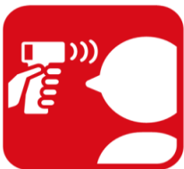
入場前の検温にご協力ください

・ご来場にあたり、JFA発信の「 来場に際しての事前のご案内 」と「 会場における禁止事項 」を遵守いただきますようお願いいたします。