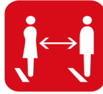
社会的距離 (できるだけ2m、最低1m)を保つようにしてください