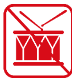
太鼓などの鳴り物