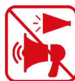
トラメガを含む メガホンの使用