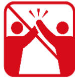
ハイタッチ、肩組み、 握手、抱擁