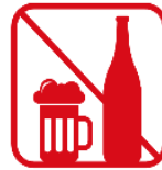
アルコール飲料の 持ち込み