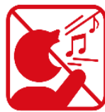
歌を歌うなど声を出しての応援、指笛