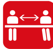
前後左右1席ずつ空けてご着席ください