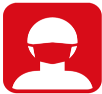
マスクを着用してください