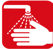
手洗い、消毒をこまめにしましょう