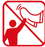
タオルマフラー、大旗含む フラッグなどを「振る・回す」