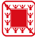
ビッグフラッグ ※ただし、お客様がいない席に 掲出する場合は除く