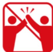
ハイタッチ、肩組み、 握手、抱擁