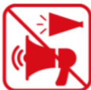
トラメガを含む メガホンの使用