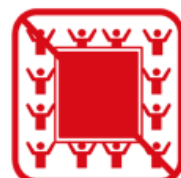
ビッグフラッグ ※ただし、お客様がいない席に 掲出する場合を除く